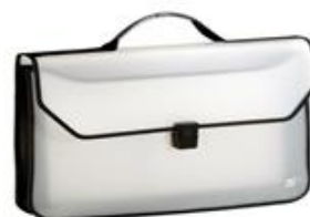
IMAGEM DA PASTA EM TAMANHO A4